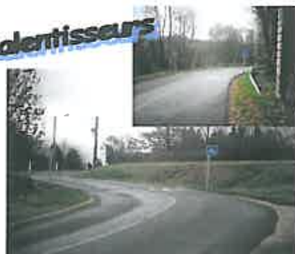
Circulation ralentie suite à la pose de dos d'anes respectant les normes