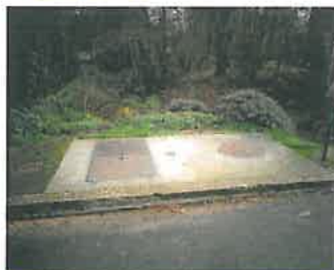
Réparation du poste de refoulement