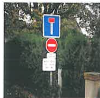
Merci de respecter les horaires