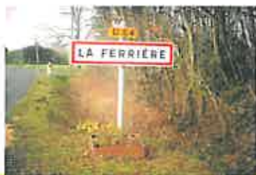
Création et installation de bacs en bois devant les 5 panneaux d'entrée de la Ferrière