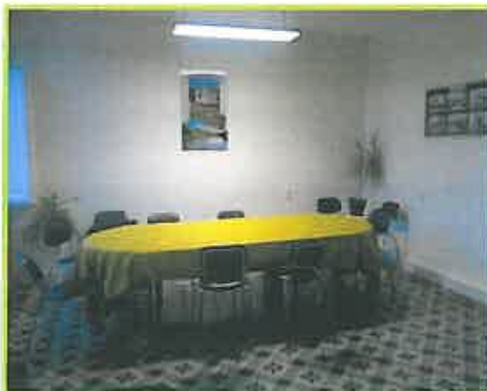
Rénovation salle du conseil ...