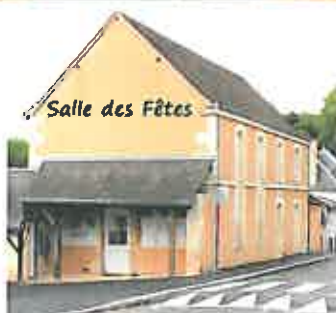
Salle des Fêtes