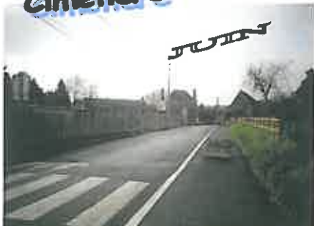
Goudronnage de l'abord du cimetière permettant une meilleure accessibilité