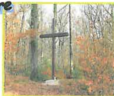
Réparation et remise en place de la croix