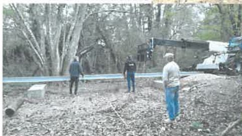
Réalisation d'une passerelle entre l'école et l'aire de jeux