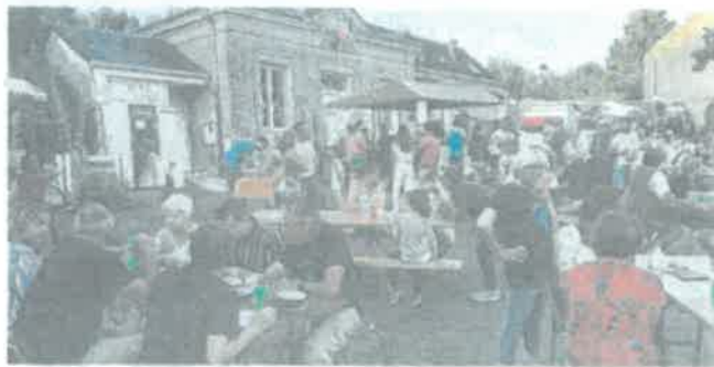
Le marché nocturne a attiré de nombreux visiteurs.